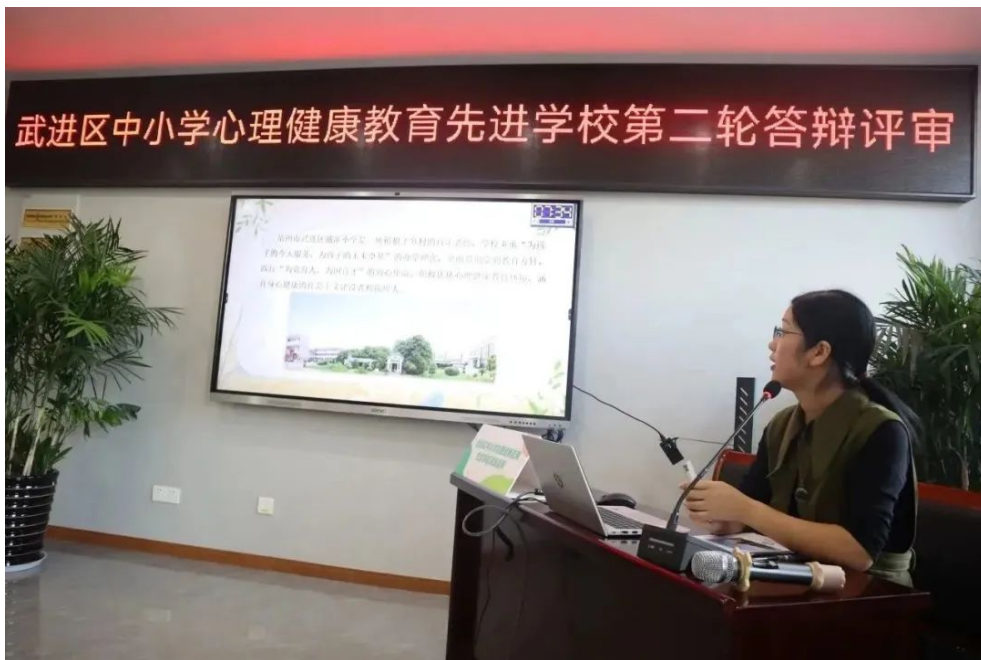
戴溪小学加强组织领导,落实推进保障,加强教育教学,促进科学发展。