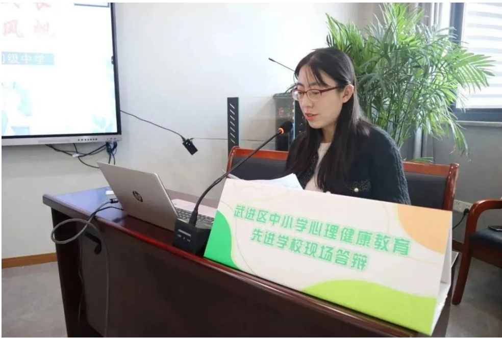
武进区人民路初级中学《润心赋能伴成长,筑梦护航扬风帆》:加强组织领导,完善资源配置,家校合力,助力圆梦,高科技,助力健康。