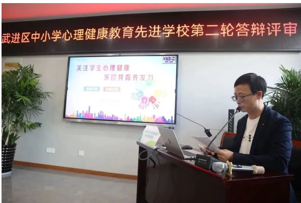
潘家小学《关注学上心理健康,家校共育齐发力》,打造心理健康教育团队,践行心理健康教育活动,构建心理健康教育模式。